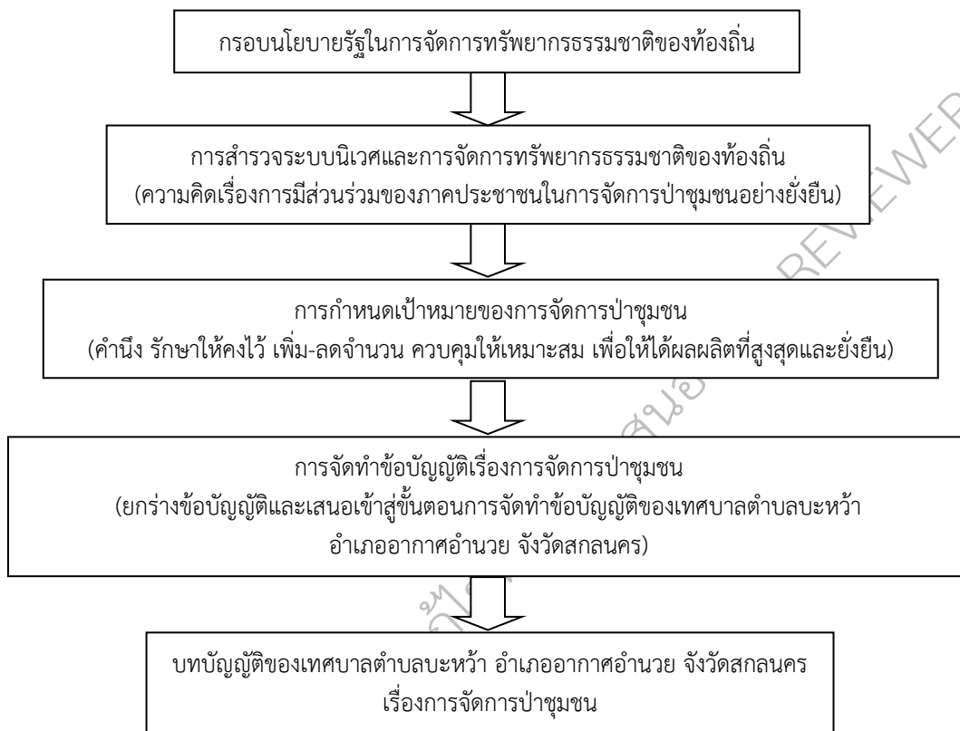
ภาพที่ 1 กรอบแนวคิดของการวิจัย

ประโยชน์ที่สอดคล้องกับความต้องการของชุมชนอย่างต่อเนื่องและยั่งยืน โดยแนวคิดพื้นฐานดังกล่าว นำมาสู่กรอบแนวคิดของโครงการวิจัย คือ การสำรวจระบบนิเวศและการจัดการทรัพยากรธรรมชาติของท้องถิ่น เพื่อกำหนดเป้าหมายของการจัดการป่าชุมชน และเสนอร่างการจัดทำข้อบัญญัติเรื่องการจัดการป่าชุมชน ยกร่างข้อบัญญัติและเสนอเข้าสู่ขั้นตอนการจัดทำข้อบัญญัติของเทศบาลตำบลบะหว้า อำเภออากาศอำนวย จังหวัดสกลนคร ต่อไป ดังภาพที่ 1